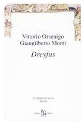
Dreyfus - Greco & Greco, 1999 -