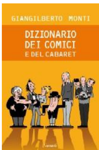
Dizionario dei Comici e del Cabaret - Garzanti, 2008 -