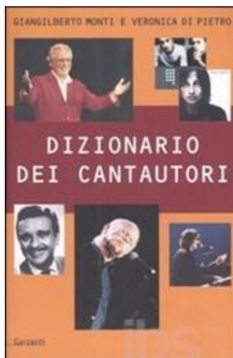
Dizionario dei Cantautori - Garzanti, 2003 -