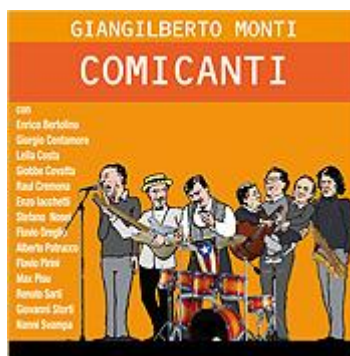
Comicanti (2009) CD Album CAROSELLO RECORDS

MORONI IN SCENA S.r.l. Via S. Michele, 65 20015 PARABIAGO (MI) P. Iva/C.F. 07252230961