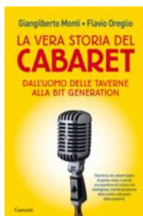
La vera storia del Cabaret - Garzanti, 2012 -