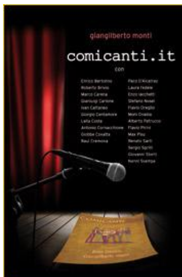
Comicanti.it (2013) doppio CD-Book EGEA MUSIC